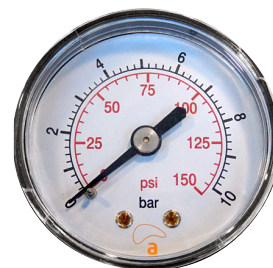
MACP Conexión Axial (trasera cónica)