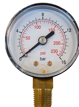
MACP Conexión Radial (lateral cónica)