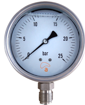
MAFHS Conexión Radial (lateral cilíndrica)