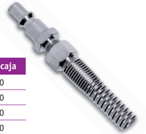
UMU - UMD Para tubo PA y PUR.