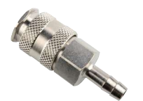
UNGE Espiga manguera.