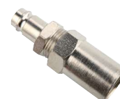
UMGP Conexión manguera. Reutilizable.