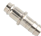
UMGE Espiga manguera.