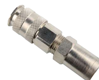
UNGP Conexión manguera. Reutilizable.