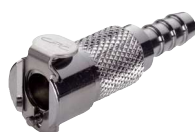
MC Recto a espiga.