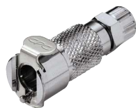
MC Recto a tubo.