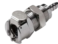
MC Recto pasamuros a espiga.