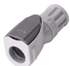
NS1 Conexión rosca hembra.