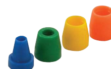
NS1 Ferrule ETFE tubo para rosca 1/4 - 28