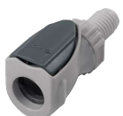
NS1 Conexión rosca macho.